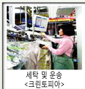
세탁 및 운송 <크린토피아>