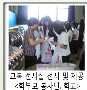
교복 전시실 전시 및 제공 <학부모 봉사단, 학교>