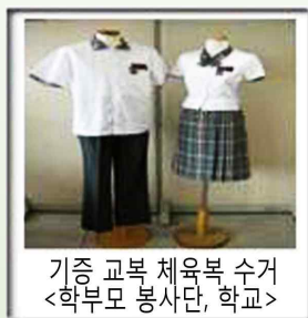
기증 교복 체육복 수거 <학부모 봉사단, 학교>

신학기가 되면 교복 값은 학생과 학부모들에겐 큰 부담이 된다. 중·고등학생들은 활동적인 시기다 보니 교복을 교체해야 하는 시기가 잦은 것도 문제다. 하지만 교복 값에 대한 걱정을 덜어줄 좋은 방안이 나왔다. 2009년 1월 교육과학기술부(이하 교과부)가 발표한 교복·체육복 나눠 입기 행사 ‘유앤아이폼(U&I form)’운동이 바로 그것이다.