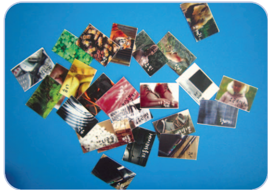
다양한 자원 모습