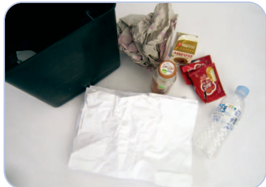
쓰레기통에서 재생 가능한 자원 확인