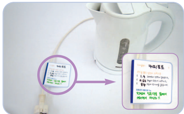
그린 라벨 부착 모습