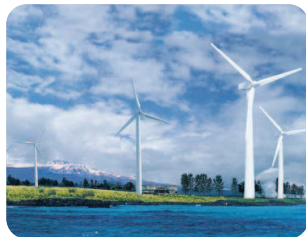
제주도 행원리 풍력 발전