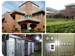
성바오로 수녀회 지열 발전