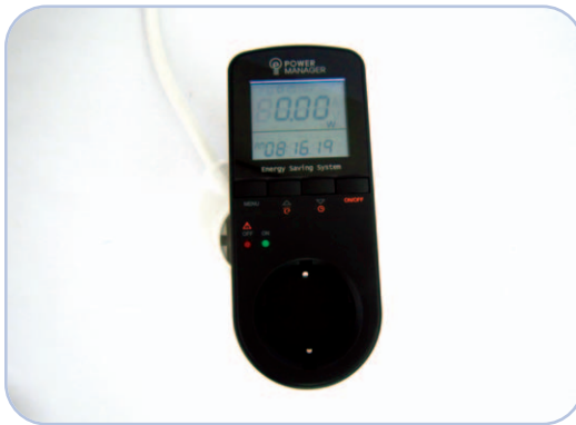
전력 측정계 작동 여부 확인