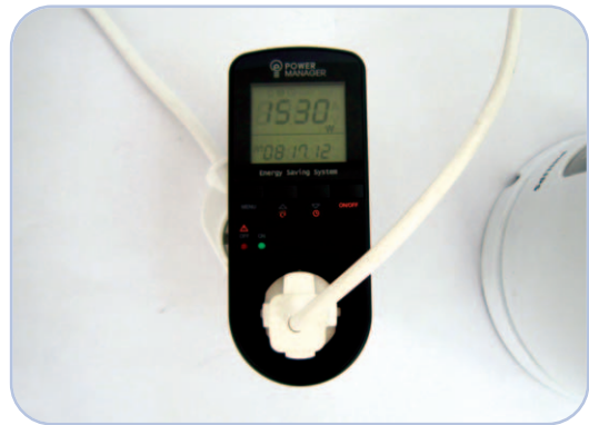
커피포트의 소비 전력 측정