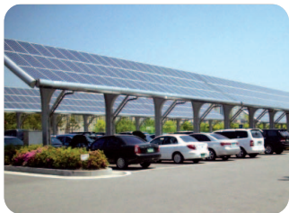
전북도청 태양광 발전